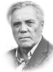
Виктор Петрович Астафьев (1924–2001)

Виктор Астафьев родился в селе Овсянка Красноярского края, на берегу Енисея. Детство писатель провёл с бабушкой и дедушкой. Это время оставило в памяти писателя много светлых воспоминаний. В 1942 году он ушёл добровольцем на фронт. После войны пробовал себя в разных профессиях и занимался литературой.