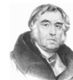
А.С. Пушкин Л.Н. Толстой Ф.И. Тютчев И.А. Крылов