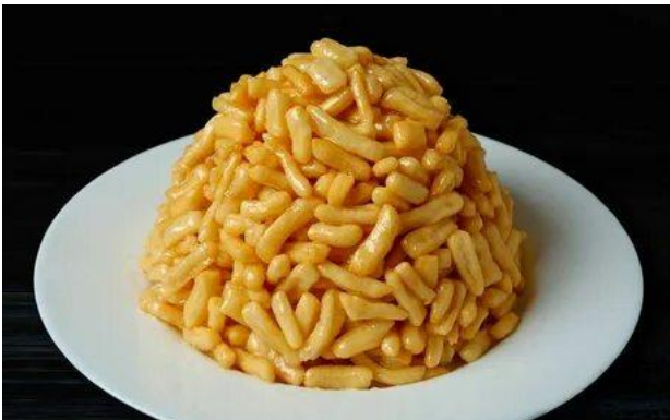
ЧАК-ЧАК (Республика Татарстан)