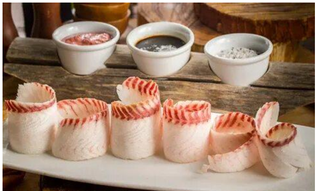
СТРОГАНИНА (Республика Саха (Якутия))