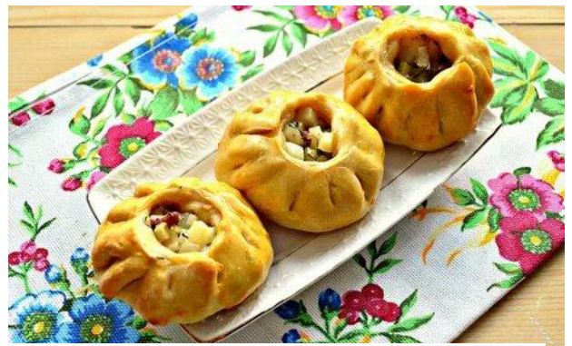
ВАК-БЕЛИШ (Республика Татарстан)