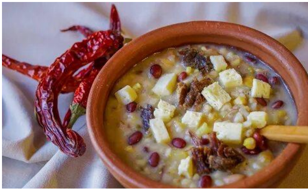
АШРАЙ (Республика Адыгея)