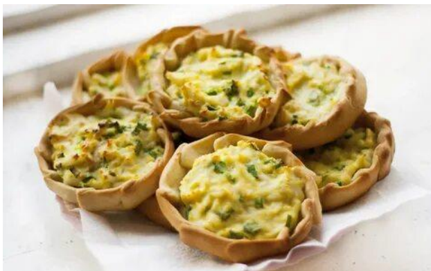
ПЕРЕПЕЧИ (Удмуртская Республика)

Учитель. Новогодние блюда народов России тоже имеют свои особенности. А сейчас я предлагаю вам посмотреть на блюда и угадать, в каком регионе России оно украшает новогодний стол.